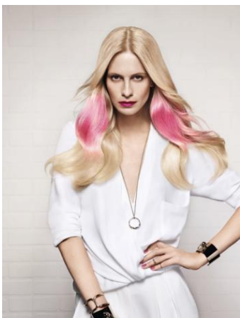
PINK SPLASHLIGHT Poppy DELEVINGNE